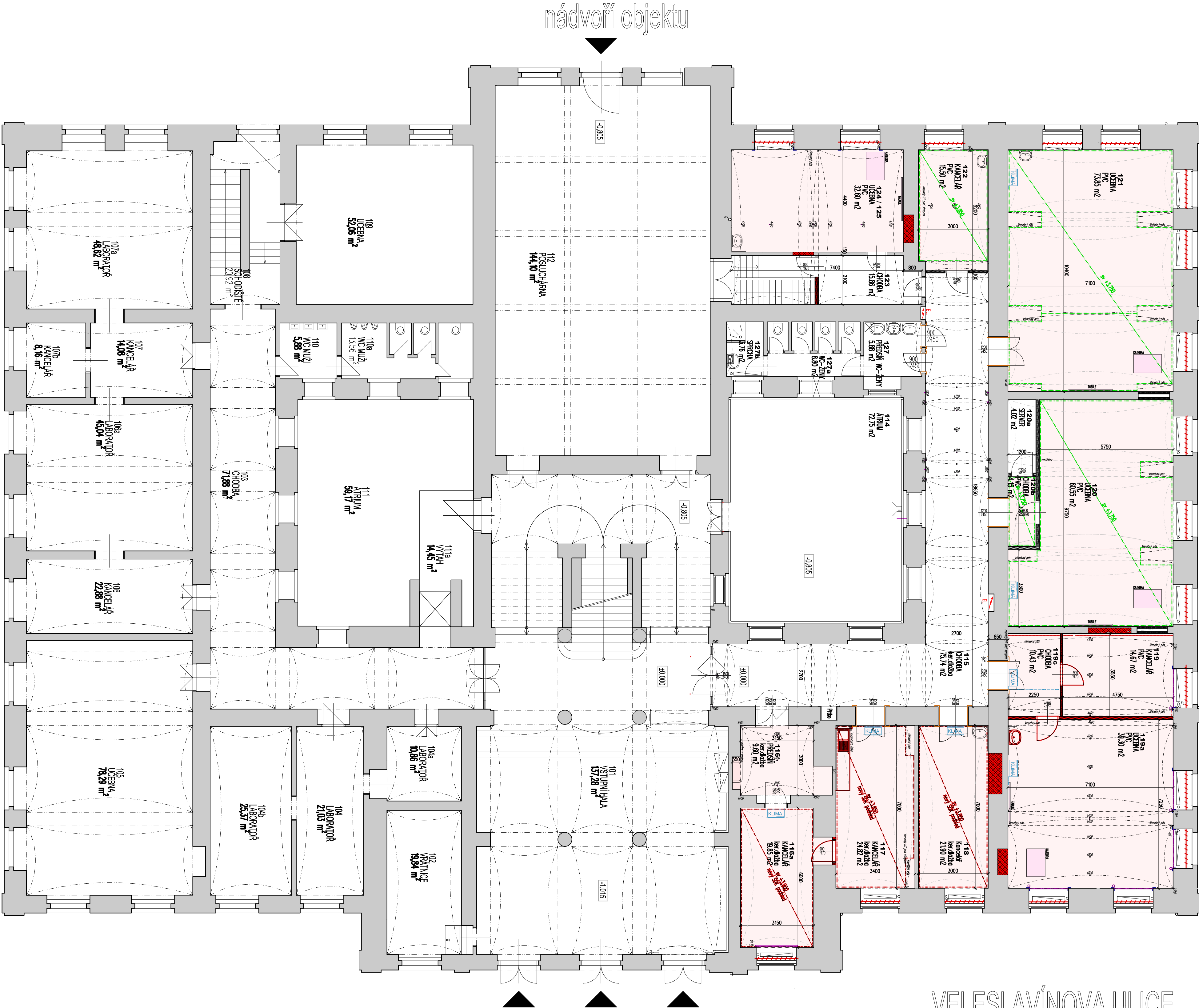
Půdorys 1.NP (navrhovaný stav) M1:100